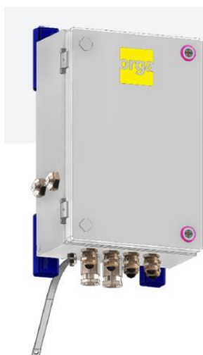
Abbildung 4-1: Steuereinheit (MLC402) für Markierungsleuchten, bis zu vier Stück