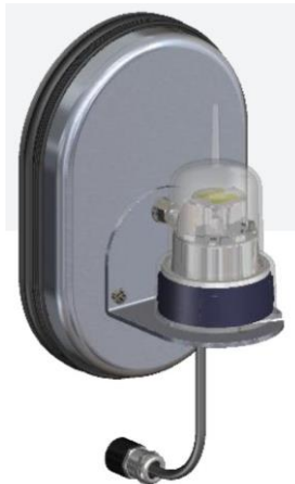
Abbildung 4-3: Turmbeleuchtung (L92-AVV-ES)